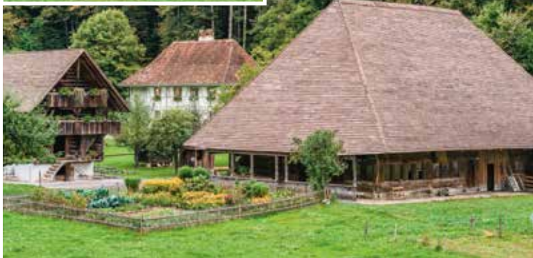
«Haus von Madiswil», Trauffront und Kopfsteinpflaster.