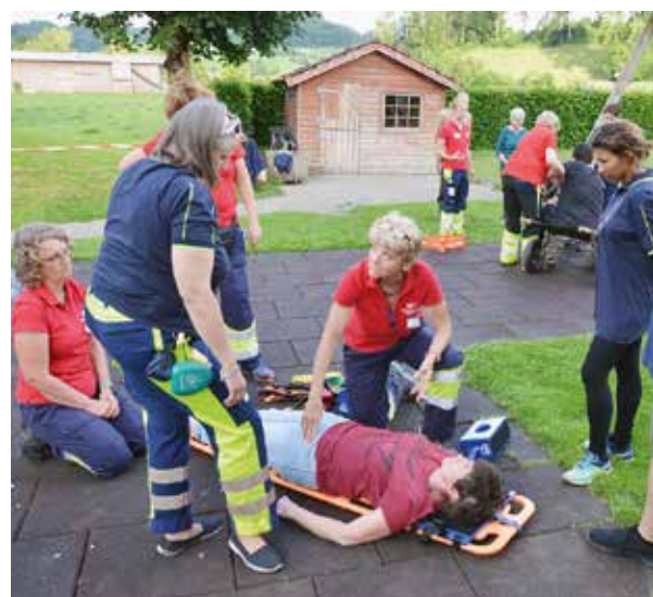
Eine Übung mit dem Rettungsbrett