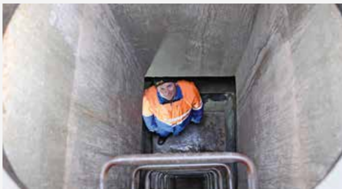
Blick in den Sammelschacht unterhalb der Käseerei Wyssbach