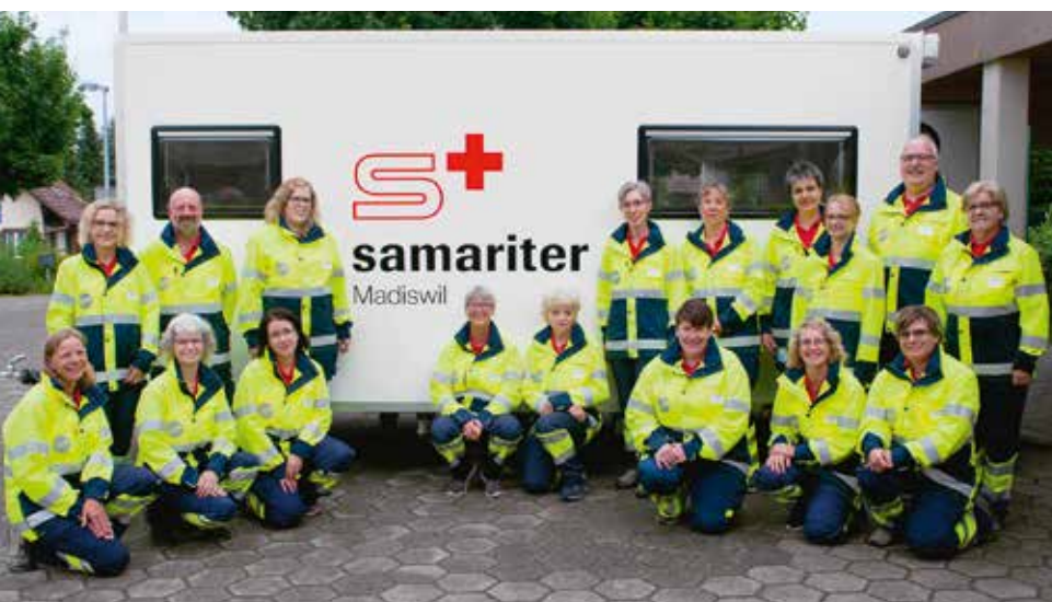
Die Samariterinnen und Samariter mit ihrem Anhänger