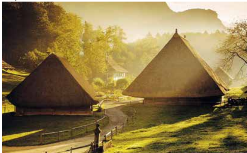
Das Bauernhaus auf dem Ballenberg (siehe auch das Bild und die Wettbewerbsauflösung auf Seite 40)