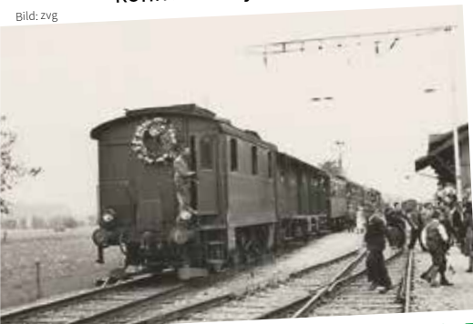
Die letzte VHB-Dampfbaufahrt 1945