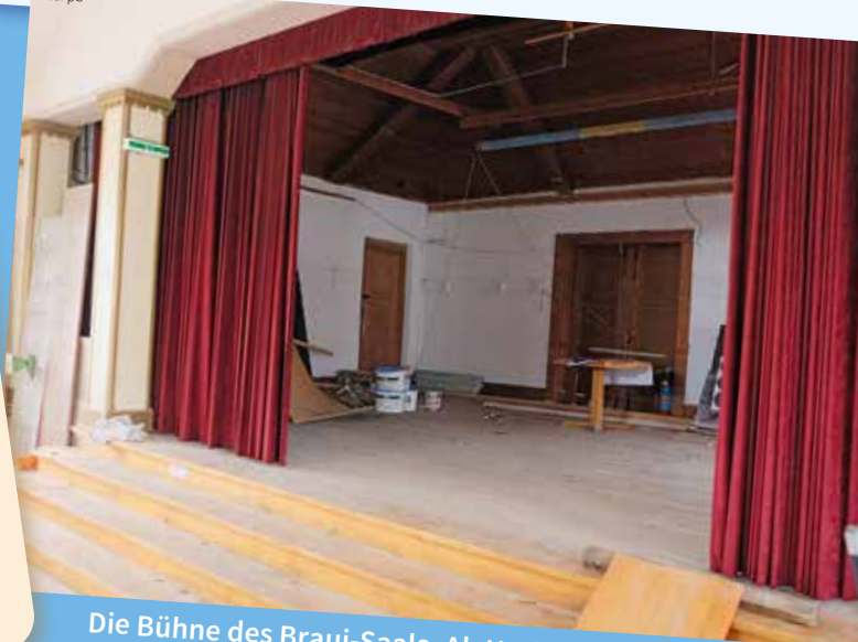
Die Bühne des Braui-Saals. Ab Herbst befinden sich dort die Behandlungsräume der Physiopraxis.