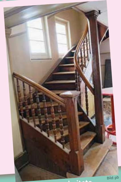
Die schön verarbeitete Holzterrasse des Braui-Saals.

Vereine wurden im Braui-Saal aufgeführt. Unter anderem natürlich der Linksmähler. Später erlebte ich Vorstellungen mit dem Turnverein, Theater und Tanz. An der Rüebechilbi wurde damals am Sonntagabend auch noch getanzt. Der Braui-Saal war wichtig für die Bevölkerung der Gemeinde Madiswil. Ein grosses Kompliment, dass der Braui-Saal wieder hergestellt und benutzt werden kann. Dass die schöne Treppe und die Galerie erhalten bleiben, gefällt mir besonders. Dem Physio-3-Team wünsche ich einen guten Start und den Patientinnen und Patienten gute Besserung! Lotti Stuker-Herrmann