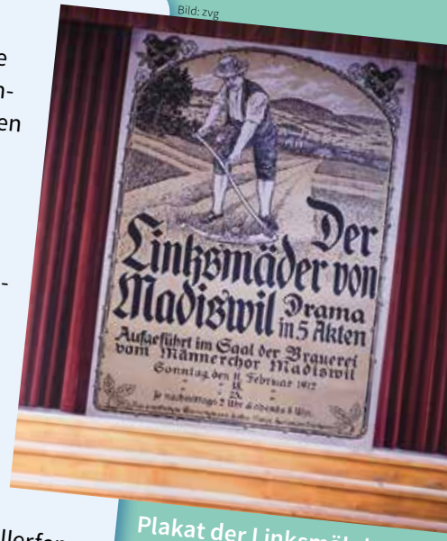
Plakat der Linksmähder-Aufführung von 1912