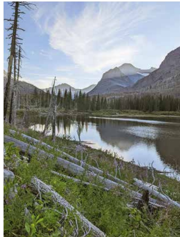
Cornelia Arn an der kanadischen Grenze. Zuvor hatte sie auf rund 5000 Kilometer wunderbare Landschaften durchwandert.