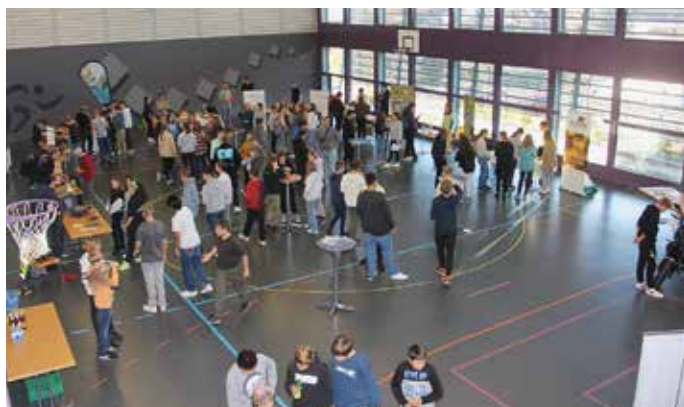
Eindrücke der Lehrstellen-Messe im Jahr 2022 mit rund 100 Schülerinnen und Schülern.