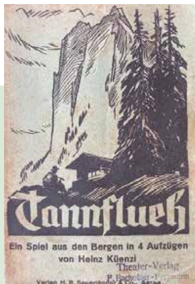
Die Titelseite einer alten Ausgabe